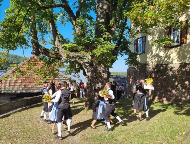
Kirmestanz unter der Linde in Unterweid am 10. September