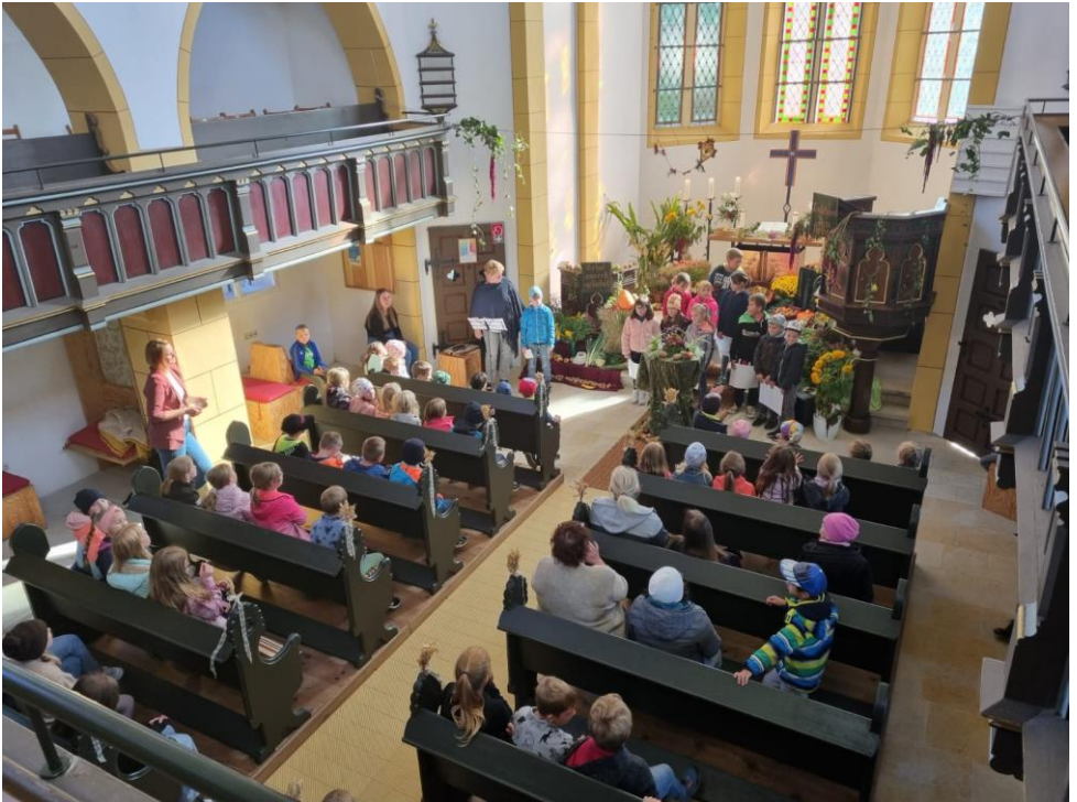
Erntedankgottesdienst der Grundschule Frankenheim am 25. September in der Kirche.