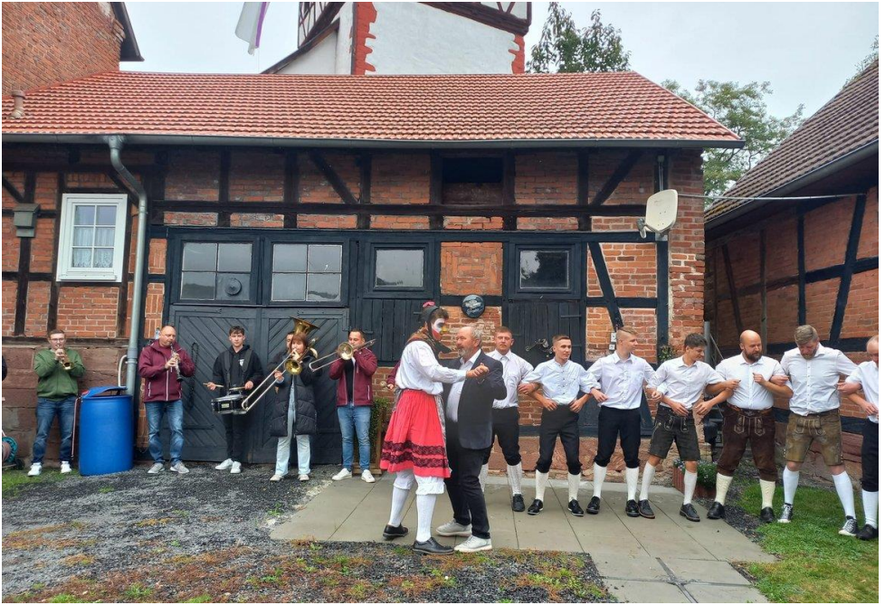
Kirmestanz mit dem „Güchel“ in Oberweid am 8. Oktober