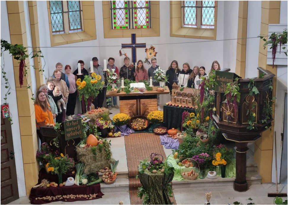
Erntedankfest am 24. September in Frankenheim und Oberweid mit wunderschön geschmückten Kirchen und vielen fleißigen Händen.