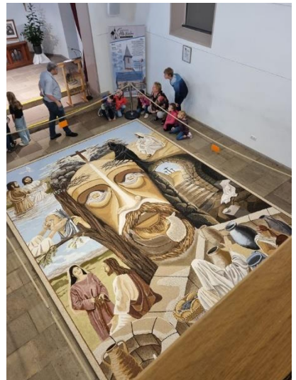
Ausflug mit dem Mädelstreff am 30. September nach Sargenzell bei Hünfeld